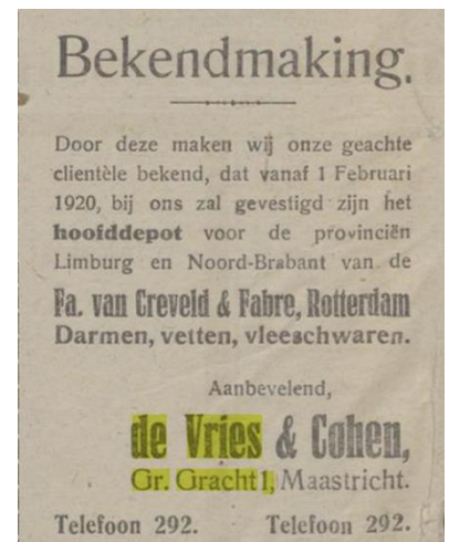
Bron: Advertentieblad voor Limburg 31 januari 1920